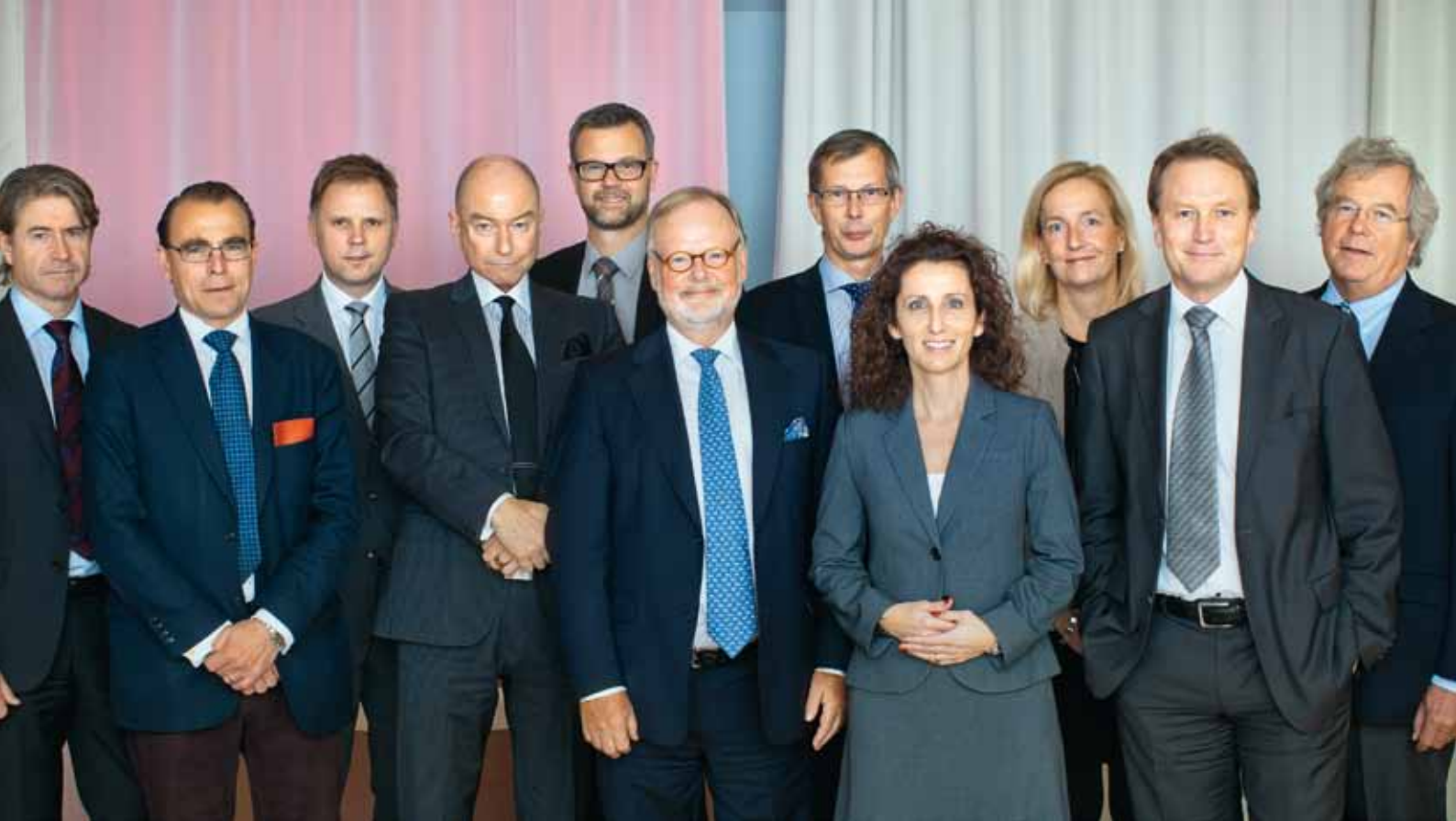
Styrelseledamöter och företagsledning i Hakon Invest.

ställande kontroll av efterlevnaden av gällande lagar och regler, se till att etiska regler för medarbetarnas uppträdande har fastställts och godkända väsentliga uppdrag som vd har utanför bolaget. Styrelsen ska också se till att informationsgivningen är korrekt, relevant, tillförlitlig och präglas av öppenhet.